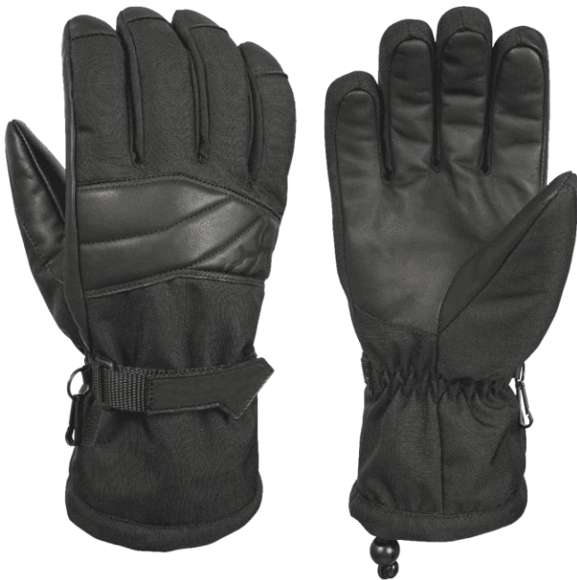
RYAN Compact Black

Zimní rukavice vhodné pro armádní operace v extrémně chladných a vlhkých podmínkách.